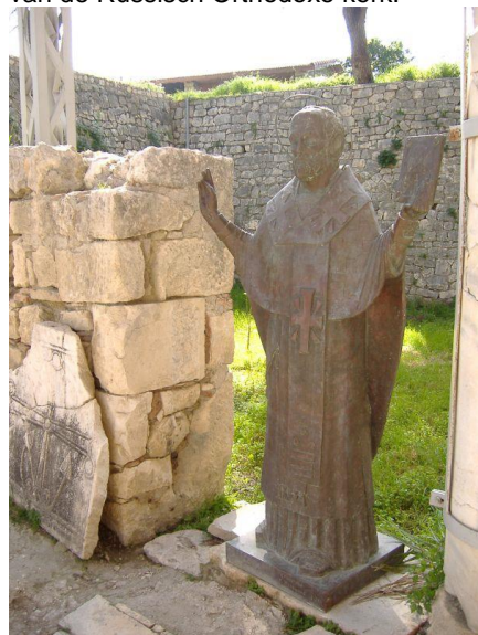
Sint Nicolaas in Demre

Sinterklaas is al eeuwen onze grote kindervriend. Hij was een bisschop in Myra, de stad Demre in het huidige Turkije. Hij is bovendien de beschermheilige van zowel Amsterdam als Moskou en de belangrijkste heilige van de Russisch Orthodoxe kerk.