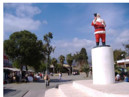
De kerstman in Demre, "Noel Baba"

[De webversie heeft mooie sinterklaaslinks]