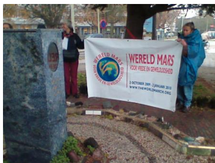
De wereldmars in 1 minuut stilte bij de Vredesvlam bij het Vredespaleis.

Compassie is de term die het beste weergeeft wat de kern is van “Love” waar de Beatles over zongen. Het is voor mijn gevoel ook de kern van het begrip Gewelddoosheid zoals Gandhi dat in de praktijk bracht. Maar Gandhi begon altijd met stilte en meditatie. Daarom vond ik de foto van 1 minuut stille bij de Vredesvlam een van de mooiste fotos die de kern van de Wereldmars symboliseerde toen die op 1,2 en 3 november in Nederland was.