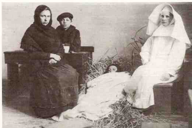
Een Nederlandse non wacht in Weert bij een stervend Frans kind, samen met de moeder en een broertje. Het vaderloze gezin (man aan het front gesneuveld) is uit Douai komen lopen.