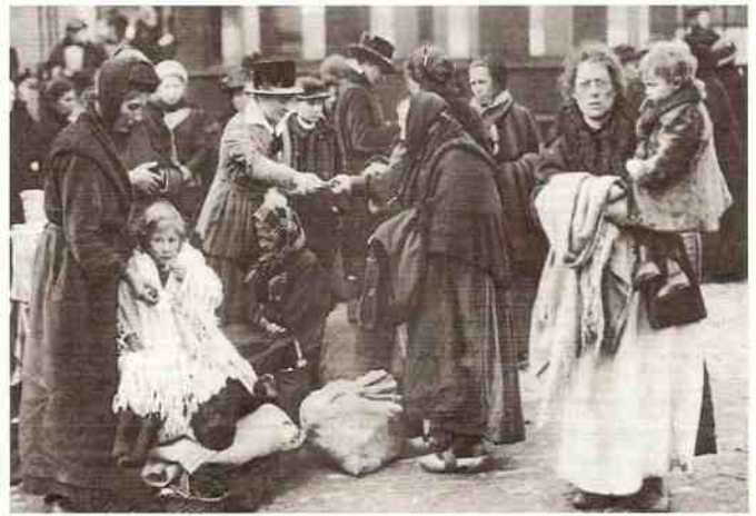
In Weert helpen Nederlandse dames bij de eerste opvang van de vluchtelingen uit Noord-Frankrijk.

In Afghanistan, gevolgd door Irak, woedt een oorlog. Er vluchten, om wat voor reden dan ook, mensen uit deze oorlogsgebieden. Zijn zij vluchteling en/of asielzoeker? In Iran zit niet een erg fris regime en in Syrië woedt een verschrikkelijke niets en niemand ontziende oorlog. Ook vandaar vluchten er mensen naar het noordelijk Europa. Zijn zij vluchteling en/of asielzoeker? En dan hebben we het ineens ook nog over allerlei bepaald onfrisse regimes