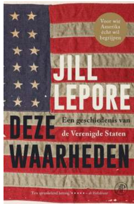
Jill Lepore (2020, Ned. vert.). Deze waarheden – een geschiedenis van de Verenigde Staten . Amsterdam-Antwerpen: Arbeidspers. ISBN 978 90 295 41688, NUR 320, 1040 pagina's, prijs € 49,99.